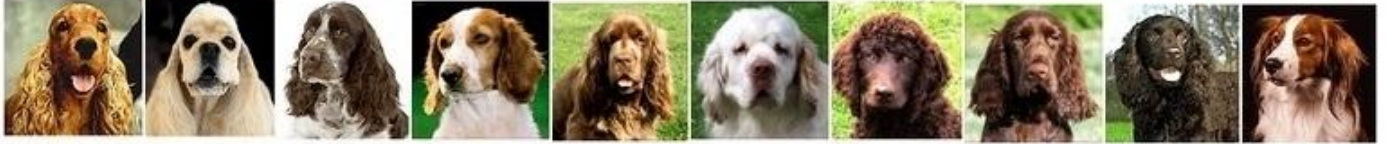
English Cocker Spaniel - Américain Cocker Spaniel - English Springer Spaniel - Welsh Springer Spaniel - Sussex Spaniel - Clumber Spaniel - Irish Water Spaniel - Field Spaniel - Américain Water Spaniel - Kooikerondje