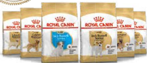
Jack Russell Terrier chiot