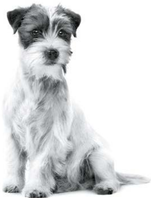
Jack Russell Terrier adulte

Pour plus d'informations, rendez-vous sur www.royalcanin.com ou prenez contact avec votre commercial Royal Canin .