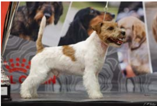
BIS CACS Rouen 2024