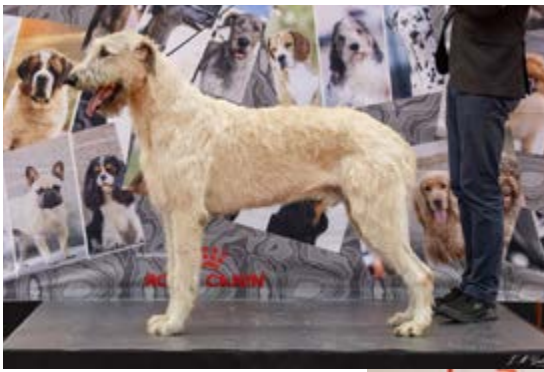
BIS CACIB Rouen 2024