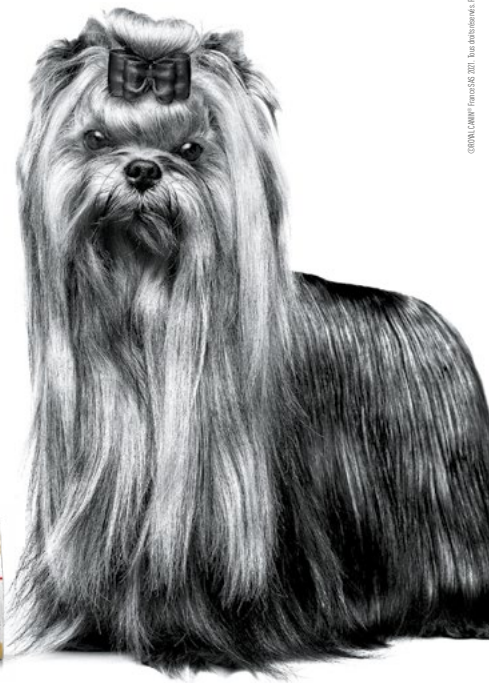
Yorkshire Terrier mature

Pour plus d'informations, rendez-vous sur www.royalcanin.com ou prenez contact avec votre commercial Royal Canin .