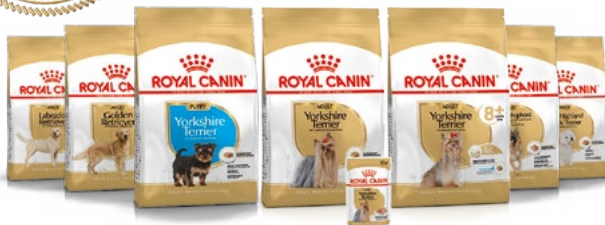
Yorkshire Terrier chiot