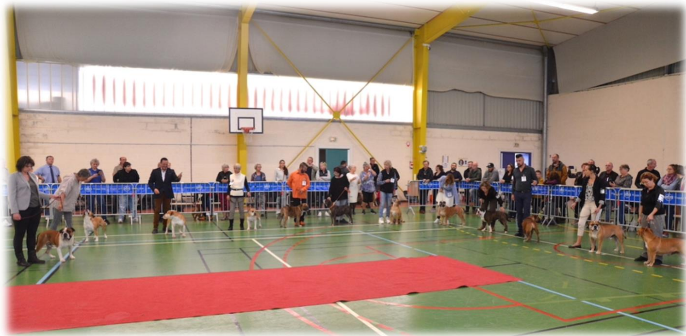
Nos 12 champions à la NE 2022

Pour notre NE 2022 nous avons 12 Champions de France présents ensemble sur le ring d'inauguration. Nous les espérons encore plus nombreux pour cette 8 ème exposition Nationale d'Élevage 2023. Ce sont eux qui défileront sur le ring en présentation de la race du Bulldog Continental à l'ouverture de cette exposition.