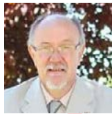
M. DE GUINEA