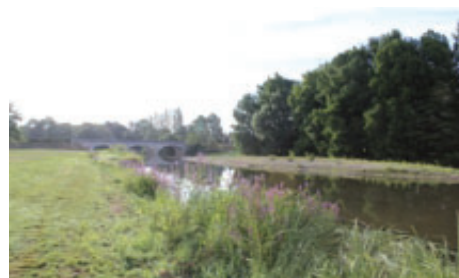
La Plage, la Sauldre, route de Mennetou

19 h 30, salle des fêtes : Dîner de clôture de la 46e Nationale d'Elevage.