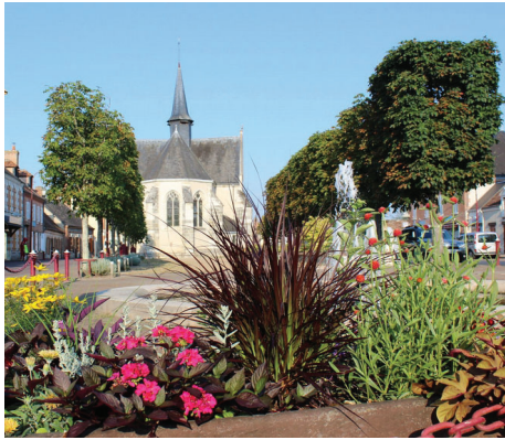
Selles-Saint-Denis, place du mail et chapelle Saint-Genoulph (XVe s.)