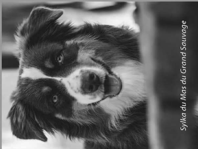
Sylka du Mas du Grand Sauvage