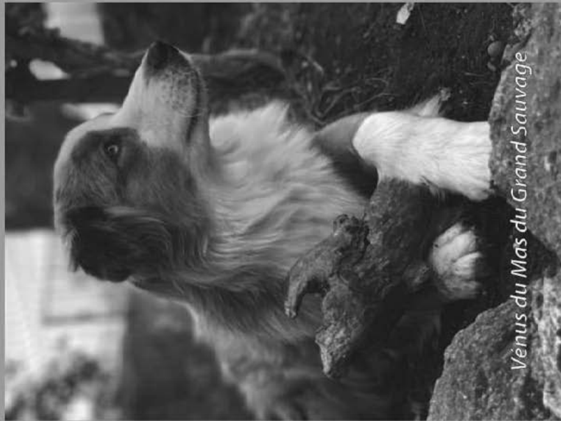
Vénus du Mas du Grand Sauvage

313 route de Codognan, 30740 Le Cailar - 06 80 90 66 49