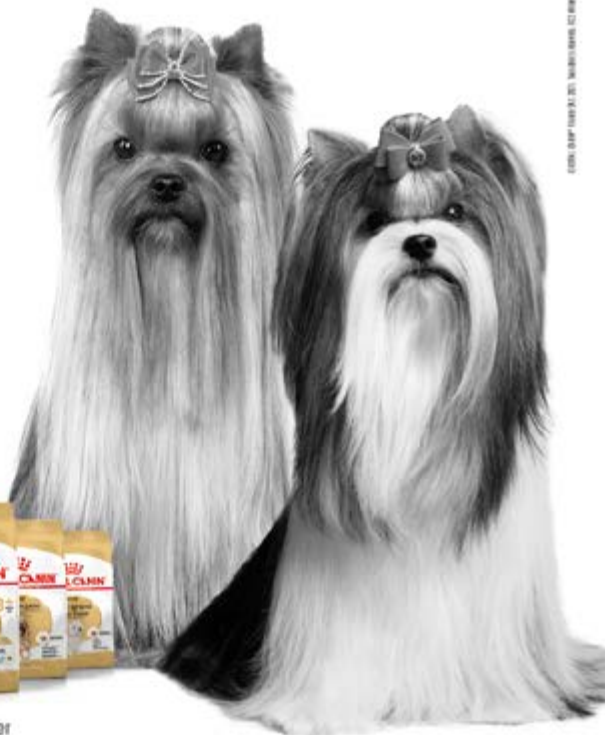
Yorkshire Terrier mature

Pour plus d'informations, rendez-vous sur www.royalcanin.com ou prenez contact avec votre commercial Royal Canin.