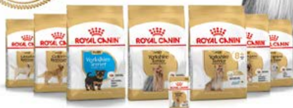
Yorkshire Terrier chiot