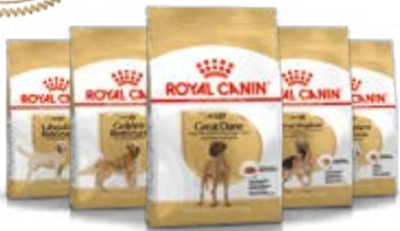
Dogue allemand adulte