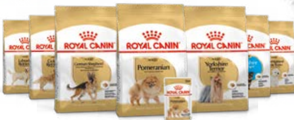
Spitz nain adulte